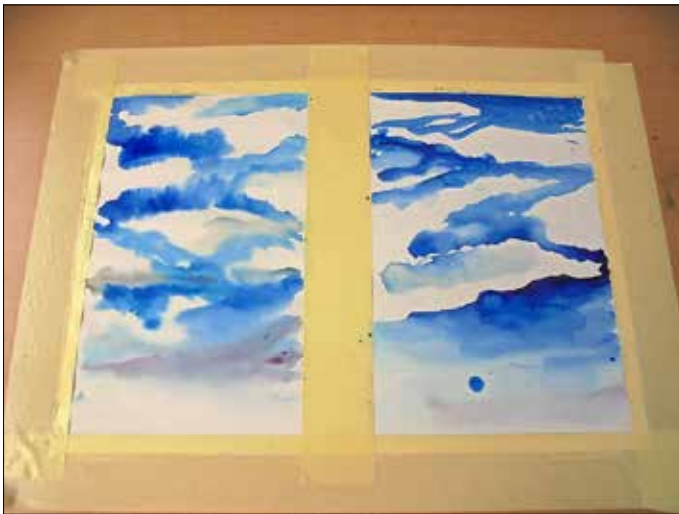
Darstellung von Wolken in Aquarelltechnik

Ermöglicht wurde die Durchführung durch eine Spende der Dresdner Klippel-Stiftung für die notwendigen Materialausgaben. Hierfür noch einmal meinen herzlichen Dank.