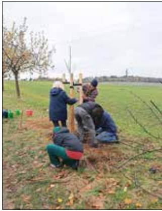
Einwohner aus Dobra pflanzen Obstbäume entlang einer alten Obstallee.

Als Dankeschön für alle Helfer gab es anschließend einen kleinen Suppenimbiss und anlässlich des Faschingsstarts einen Pfannkuchen für jeden. Sogar das sogenannte „Dobra-Lied“ erklang zum Abschluss... die erste „musikalische Pflanzaktion“! Bilanz des freiwilligen Arbeitseinsatzes: Eine tolle Veranstaltung, die aus Sicht des Ortschaftsrates nach einer Wiederholung verlangt. Denn der jetzt bepflanzte Rand des Wanderweges erstreckt sich noch weiter und weist zwischen alten Obstbäumen weitere Lücken auf. Vielleicht auf ein Neues im nächsten Jahr? Danke an alle, die mit angepackt haben!